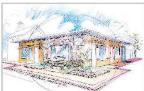
Un bozzetto dei negozi del villaggio «Il paese ritrovato» di Monza. Sabato la posa della prima pietra, apertura nel 2018