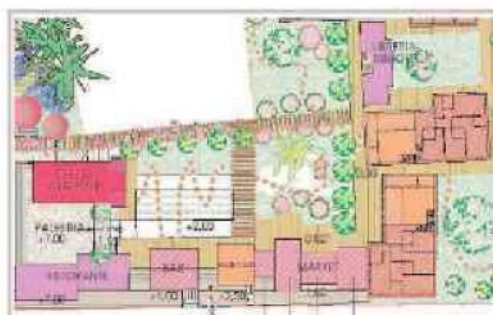
Una delle piantine del «Villaggio A» di Cardano al Campo, con aree in cui girare da soli o con l'operatore. Inaugurazione nel 2019