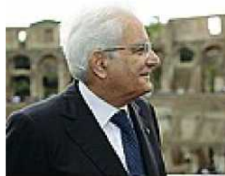
Tesori In alto, il Toro di Nimrud. Sopra, il soffitto del Tempio di Bel a Palmira. A sinistra, il presidente della Repubblica Sergio Mattarella ieri all'inaugurazione della mostra